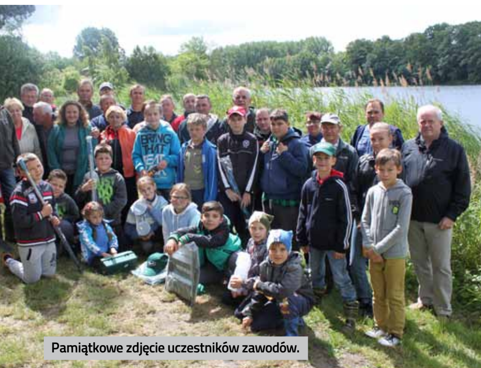
Pamiątkowe zdjęcie uczestników zawodów.